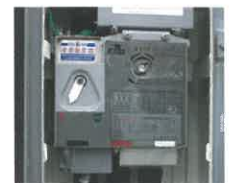
UGS (地中線用負荷開閉器)