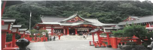
太鼓谷稲成神社 日本五代稲荷の一つに数えられています。津和野藩主の第7代・亀井矩貞が藩内の平安と住民たちの穏やかな暮らしを祈願し、京都の伏見稲荷大社を勧請したのが始まりです。参道には、約1000本の朱塗りの鳥居がトンネルのように続いています。