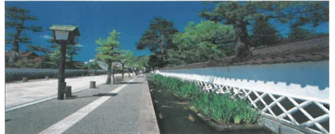
町の中央通り両側にある堀割の水路沿いに花菖蒲が育ち、大きな鯉が泳いでいます。道ゆく人々にエサをおねだりします。