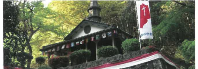
乙女峠マリア聖堂 長崎浦上村から配流となったキリシタン殉教者を追悼するために建てられた聖堂。故永井博士による小説「乙女峠」に由来し、「乙女峠マリア聖堂」と呼ばれています。