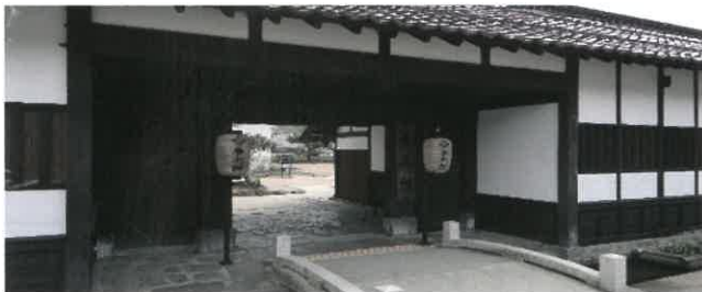
藩校養老館 西周(哲学者)森鷗外(文豪)等明治の日本近代化に貢献する人材を輩出した。