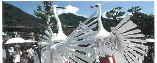
弥栄神社の鶯舞(重要無形文化財)寛永20年(1643年)京都より疫病鎮護の為に継承される。