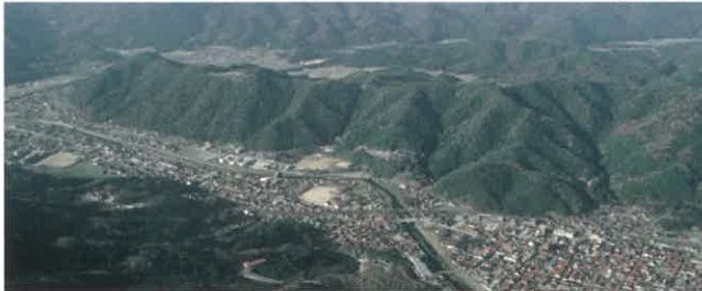
津和野城跡より見る津和野町 人口約7000人 D-51が走る観光の町です。

津和野は、山あいには白壁と赤瓦の家並みがつづき、西に山城の石垣が見える約700年続いた城下町です。明治8年に城は解体されました。東西4Kmに満たない城下町ですが昔の遺跡や建物が大切に保存されており初めての旅行者に驚きと感動を与えてくれます。